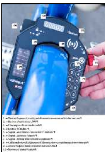
lucchetto elettronico V. 2.0

L'applicazione, attualmente utilizzabile e scaricabile sia per iOS che per Android, permette di avere una visione d'insieme delle postazioni e del numero di biciclette stazionate in modo da poter verificare sempre la disponibilità oltre che la distanza che ci separa dalla stessa.