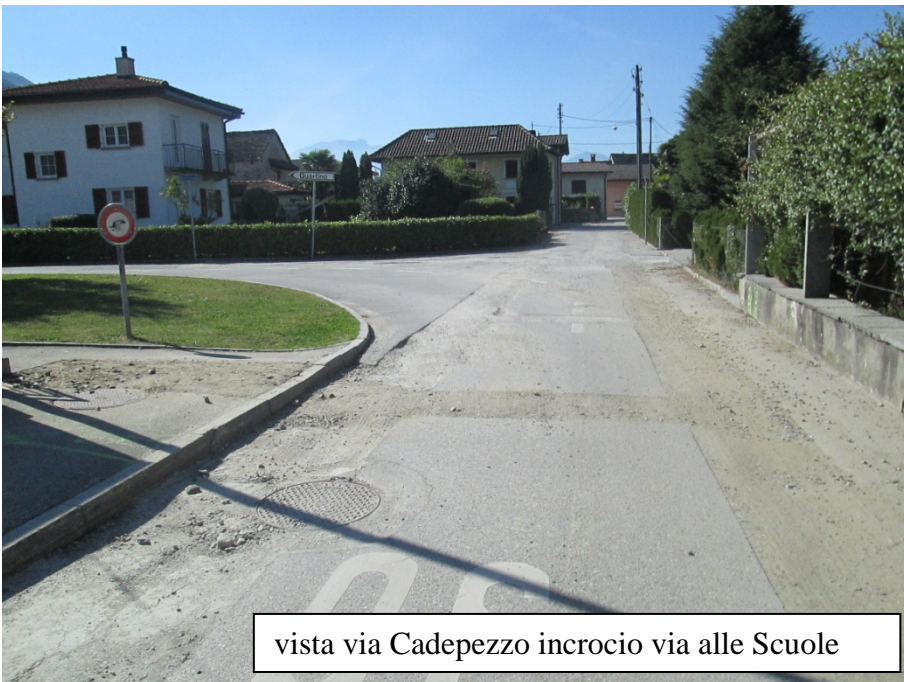
vista via Cadepezzo incrocio via alle Scuole