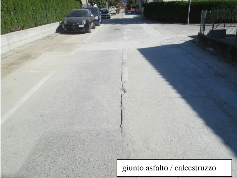
giunto asfalto / calcestruzzo