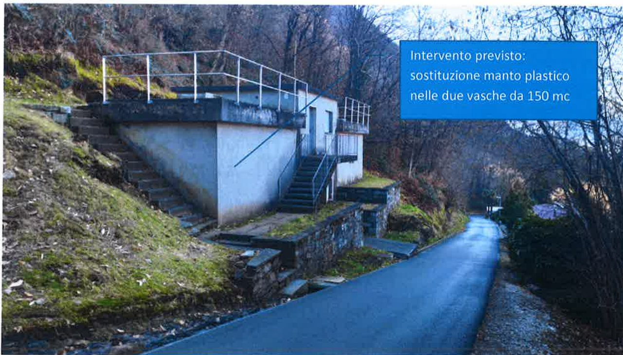
Bacino di Orgnana: